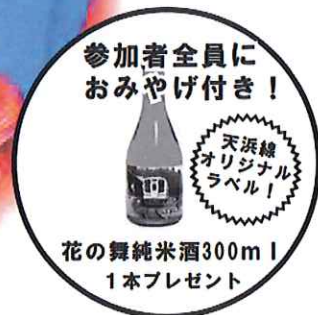
参加者全員に おみやげ付き！ 花の舞純米酒300ml 1本プレゼント